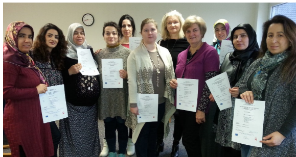
Abschluss Qualifizierung Lernbegleiterin Grundmodul