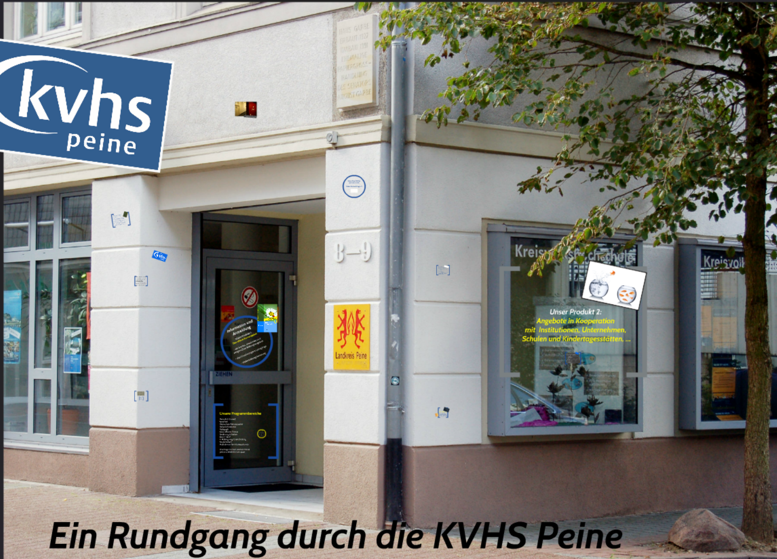
Ein Rundgang durch die KVHS Peine