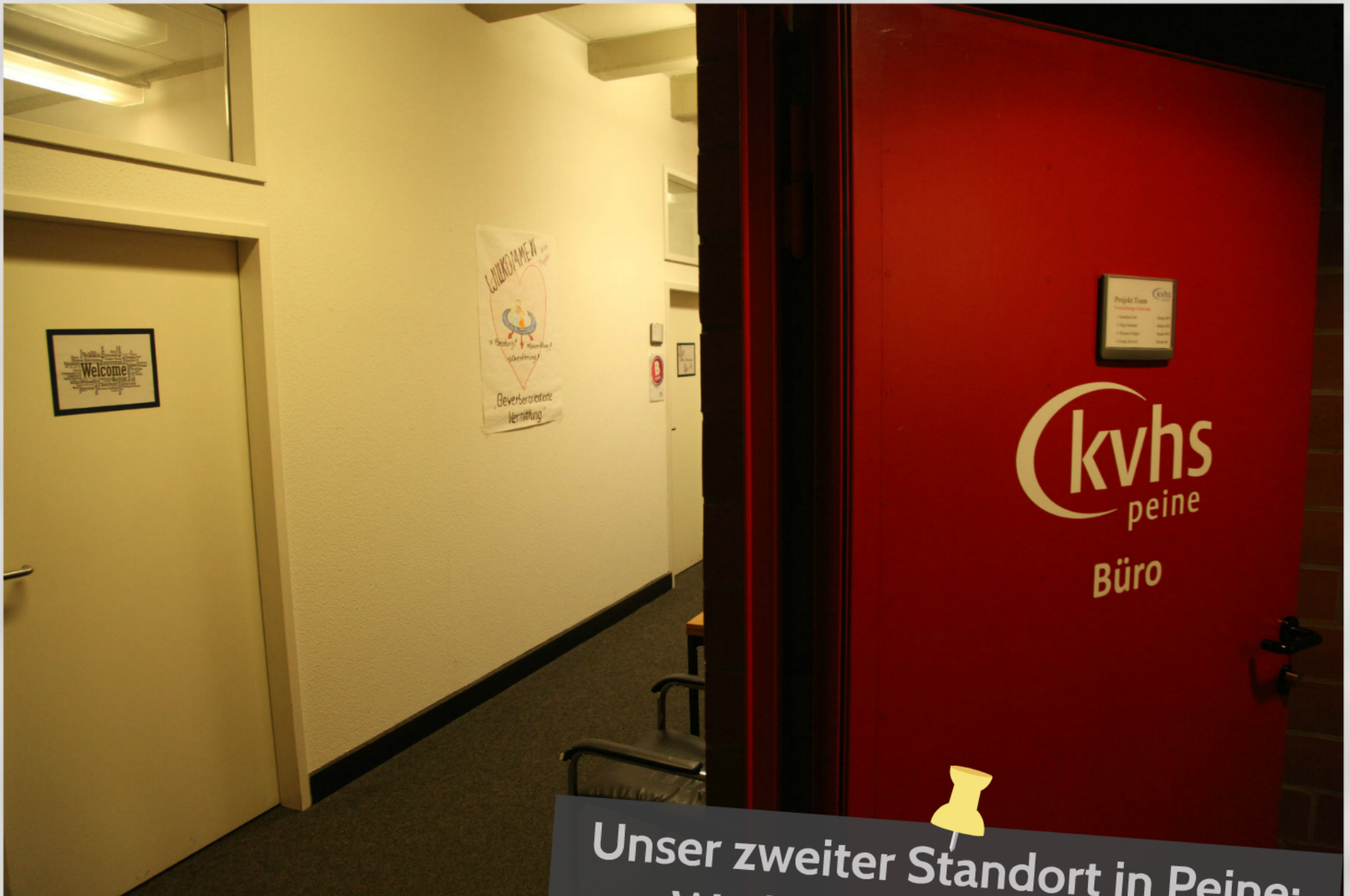
Unser zweiter Standort in Peine: Werkforum Herner Platz