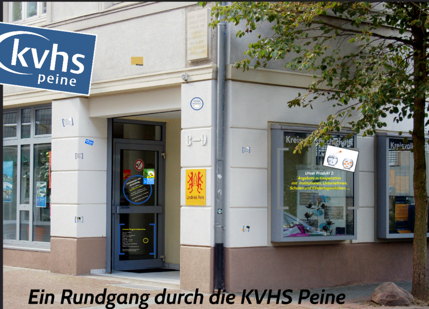
Ein Rundgang durch die KVHS Peine